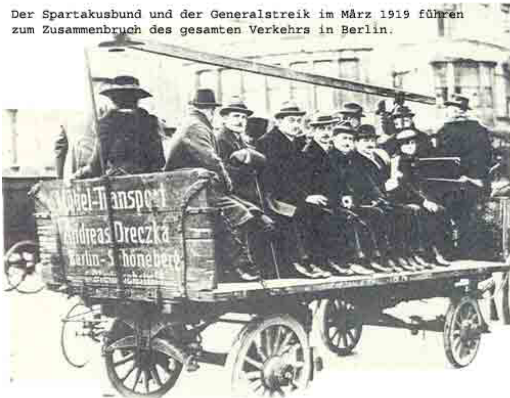
Der Spartakusbund und der Generalstreik im März 1919 führen zum Zusammenbruch des gesamten Verkehrs in Berlin.

viele auch ansonsten gemäßigte Soldaten und Arbeiter. Hier ist der Zusammenhang zwischen unterlassenen Reformen und politischer Radikalisierung deutlich greifbar. Dasselbe gilt für die Forderung des Kongresses nach Sozialisierung "der hierfür reifen Industrien", vor allem des Kohlebergbaus. Die von der Regierung eingesetzte Sozialisierungskommission war lediglich ein Versuch, Zeit zu gewinnen. Der MSPD und den Gewerkschaften ging es darum, Änderungen der Eigentumsverhältnisse zu verhindern. Dieses Beharren auf dem überkommenen kapitalistischen Wirtschaftssystem lässt sich, was den Fortgang der ökonomischen Entwicklung betrifft, zumindest teilweise mit dem marxistisch geprägten Determinismus der SPD, d. h. mit ihrem Glauben an die "gesetzmäßige" Vorbestimmtheit der Entwicklung, erklären, der grundlegende sozialökonomische Veränderungen mehr von der allgemeinen gesellschaftlichen Entwicklung als von zugreifenden politischen Eingriffen erwartete und von den sozialökonomischen Voraussetzungen für Bestand und Gedeihen einer Demokratie kein klares Bewusstsein hatte.