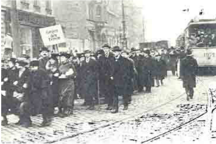
Demonstration der Mehrheitssozialisten gegen den Spartakusbund im Dezember 1918 in Berlin.

der SPD noch Philipp Scheidemann und Otto Landsberg, von der USPD Hugo Haase, Wilhelm Dittmann und Emil Barth an. Die neue- Regierung hielt es für unverzichtbar, die Anerkennung und Mitarbeit der OHL zu erreichen, um die sich aus der Situation des geschlagenen Reiches ergebenden unmittelbaren Aufgaben lösen zu können: