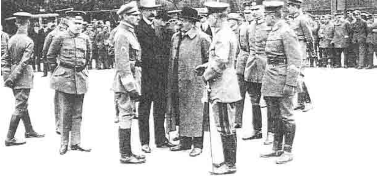
Nach der Niederschlagung der Räterepublik wurde das bayerische Heer im August 1919 in die 100 000-Mann-Reichswehr übernommen. In der Mitte (von links): Oberst Ritter von Epp, der SPD-Reichswehrminister Gustav Noske und Reichspräsident Friedrich Ebert.

zurückzutreten, wurde er von dem nationalistischen Fanatiker Graf Anton von Arco-Valley ermordet. Der Mord an Eisner wirkte radikalierend auf die Arbeiter und Soldaten und leitete in Bayern die „zweite Revolution“ ein, die sich im „Zentralrat der Bayerischen Republik“ unter dem Vorsitz von Ernst Niekisch (SPD) ein neues Führungsorgan schuf. Nach wochenlangen Wirren beschloss dieses, zusammen mit dem Revolutionären Arbeiterrat, in der Nacht vom 6. auf den 7. April die Ausrufung einer Bayerischen Räterepublik, in der Intellektuelle (Toller) und Anarchisten (Landauer), nicht jedoch Kommunisten die „Regierung der Volksbeauftragten“ bildeten: Die Kommunisten bezeichneten das aus dieser „dritten Revolution“ hervorgegangene Regime als „Scheineräterepublik“.(18)