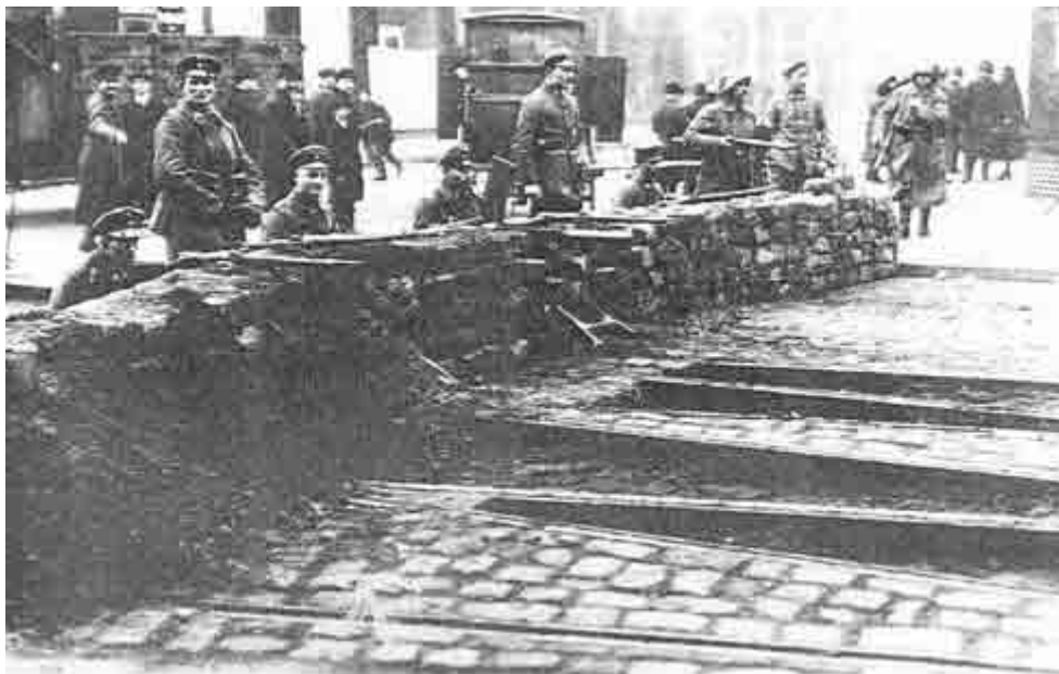
Barrikade der Regierungstruppen am Spittelmarkt in Berlin während des Generalstreiks am 24. April 1919